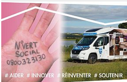
Numéro Vert Social