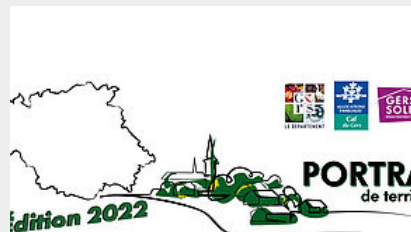
Portrait de territoire Édition 2022