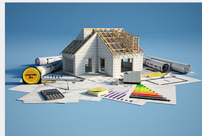
L'habitat indigne, Incurie