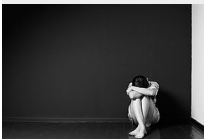
Les violences faites aux femmes